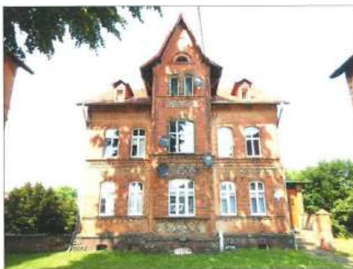
Widok elewacji frontowej – ul. Warszawska nr 10.

na sprzedaż lokalu mieszkalnego Nr 2, znajdującego się w budynku położonym w Lubaniu przy ul. Warszawskiej 10 wraz z udziałem we współwłasności nieruchomości gruntowej (działka nr 22, AM 10, Obręb III o powierzchni 161 m 2 , JG1L/00035381/8)