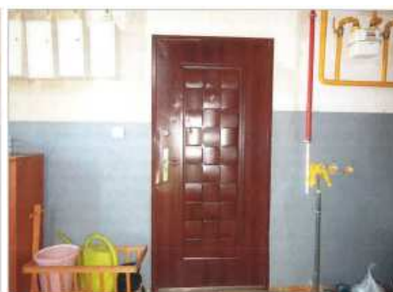
Wejście do lokalu.