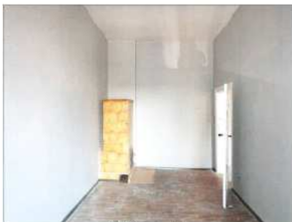
Widok fragmentu pokoju.