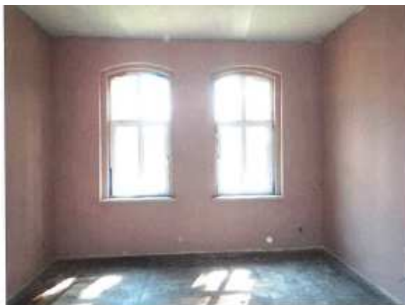
Widok fragmentu kuchni.