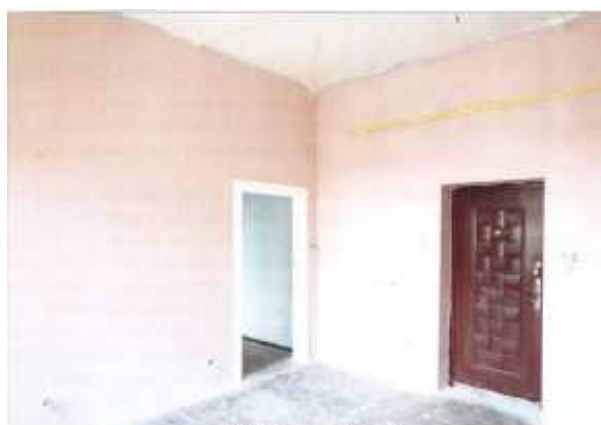
Widok fragmentu kuchni.