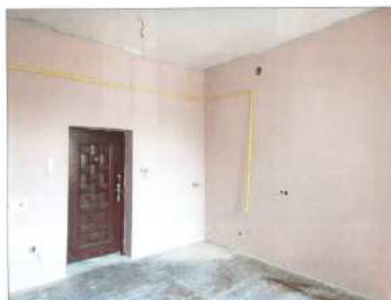
Widok fragmentu kuchni.