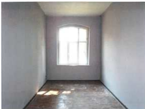
Widok fragmentu pokoju.