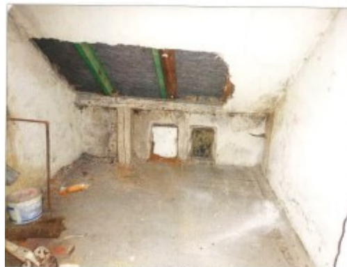
Widok fragmentu ciemnej kuchni.