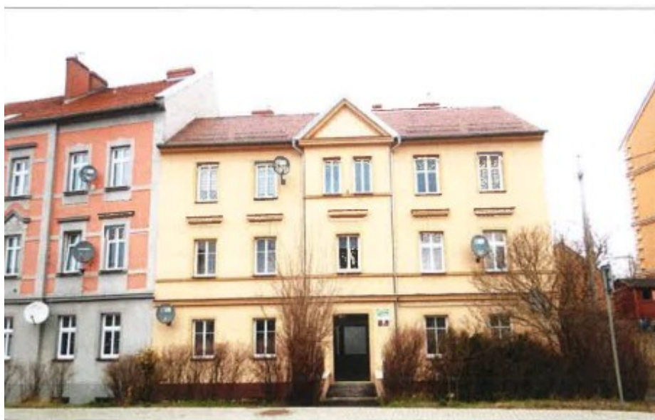
Widok elewacji frontowej – Lubań, ul. Jeleniogórska nr 9.

na sprzedaż lokalu mieszkalnego Nr 5 znajdującego się w budynku położonym w Lubaniu przy ul. Jeleniogórskiej 9 wraz z udziałem we współwłasności nieruchomości gruntowej (działka nr 5, AM 12, Obręb IV o powierzchni 147 m 2 , JG1L/00016319/4)