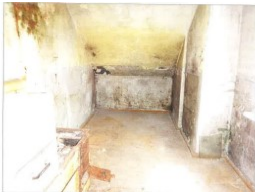
Widok fragmentu pokoju II.